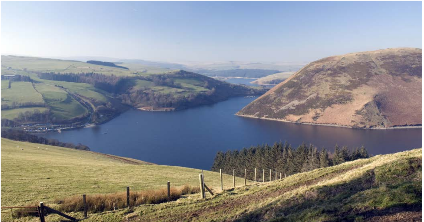
(uchod) Cronfa Ddŵr Llyn Clywedog

ar wahaniaethau ond gan barhau i adael lle i symud i weinyddiaethau unigol er mwyn addasu i amgylchiadau lleol – er enghraifft, yn yr un modd â'r Polisi Amaethyddol Cyffredin (casgliad a gymeradwywyd ar gyfer cyfraith ddomestig y DU gan y Llys Apêl yn 'achos Horvath' 2 ). Mae'n werth nodi, fel enghraifft, bod safonau amgylcheddol o dan Gyfarwydddebau'r UE yn caniatáu i'r gweinyddiaethau fod yn wahanol ar hyn o bryd, felly ni ddylid rhagdybio y bydd cydgyfeiriant o dan fframweithiau'r DU yn y dyfodol, ac eithrio lle bo hyn yn angenrheidiol i sicrhau canlyniad polisi cyffredin y cytunwyd arno.